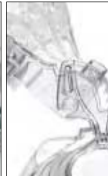
Support frontal ajustable quatre positions au choix pour une meilleure étanchéité et une meilleure stabilité