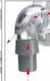
Orifices de ventilation de conception unique pour réduire le bruit par réorientation du débit d'air inspiré et expiré