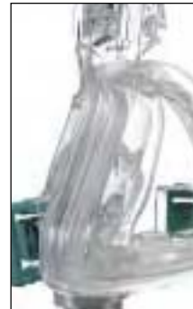
Bulle à double jupe Mirage pour optimiser l'étanchéité et minimiser la pression sur l'arête nasale

Le masque nasal Ultra Mirage fait ses preuves depuis plus de cinq ans. Le masque nasal Ultra Mirage II continue à redéfinir ce que vous êtes en droit d'attendre d'un masque nasal de grande qualité.