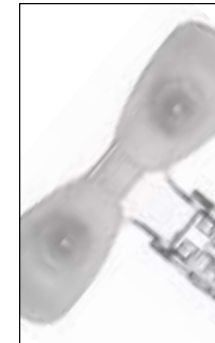
Tampon frontal monopièce souple pour s'adapter à la forme de votre visage