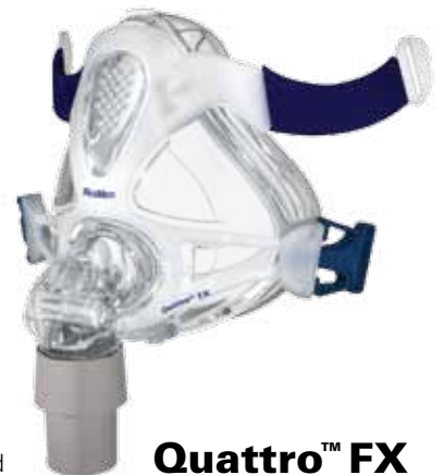
Quattro™ FX FULL FACE MASK

Den tekniskt avancerade Spring Air mjukdelen ger en jämn fördelning av trycket och absorberar den minsta rörelse. Användaren kan lita på att förseglingen håller tätt och kan se fram emot en god natts sömn.