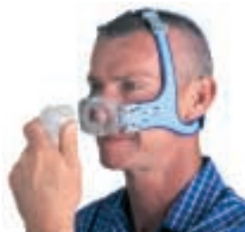
Snäppbåge - enkelt och praktiskt