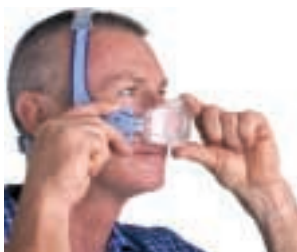
Lättmonterade delar - förenklad användning