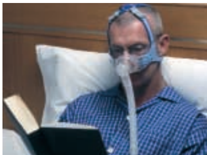
Med Mirage Vista kan patienterna följa alla inbunda kvällsrutiner innan de somnar.