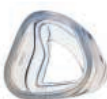
Mirage design för mjuk kudde med optimal försegling