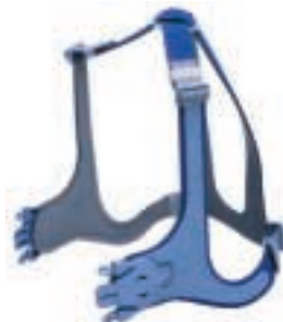
En inpassning - utan justeringar