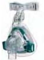
Masque nasal Mirage Activa avec technologie ActiveCell