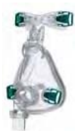
Masque facial Ultra Mirage pour la gestion des fuites buccales et du traitement