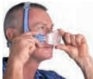
Quick Connect Verbindungen - einfachste Handhabung.