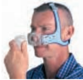
Easy Lock Schlauchanschluss - einfach und bequem.