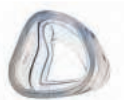
Mirage Maskeneinsatztechnologie - weich und bequem für optimalen Maskensitz.