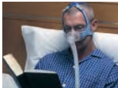
Mit der Mirage Vista können Patienten ihren normalen Schlafvorbereitungen nachgehen.