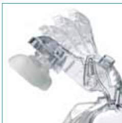
Säädettävä otsatuki — neljä selkeästi numeroitua asentoa