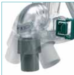
Pyörivä kulmakappale — ilmaletku voidaan asettaa vapaammin