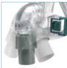
Drehbares Kniestück — Flexibilität bei der Luftschlauchposition