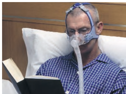
Le masque Mirage Vista permet aux patients de ne pas changer leurs habitudes de coucher.