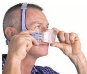
Composants Easy Lock – manipulation plus aisée