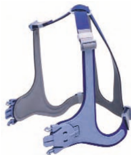
Harnais Set & Forget – aucun réajustement nécessaire